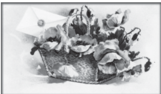
Tomado de Jorge Ibarguengoitia, Instrucciones para vivir en México , Joaquín Mortiz, México, 1999 (Obras de Jorge Ibarguengoitia), pp. 294-295.

Cuando yo fui a los Estados Unidos, se quedó a cargo de mi mujer, inglesa, y de su doctora, austriaca, quienes mandaron hacer análisis para ver si mi madre estaba en condiciones de comerse un huevo de vez en cuando y un caldito de pollo los domingos. No se imaginaban que la enferma, mexicana, que siguió dominando a la servidumbre hasta el final, estaba comiéndose en tres semanas un ejército de quesadillas de huitlacoche, tlacoyos, gordas de maíz quebrado, tamales de chile verde y rojo, etc.