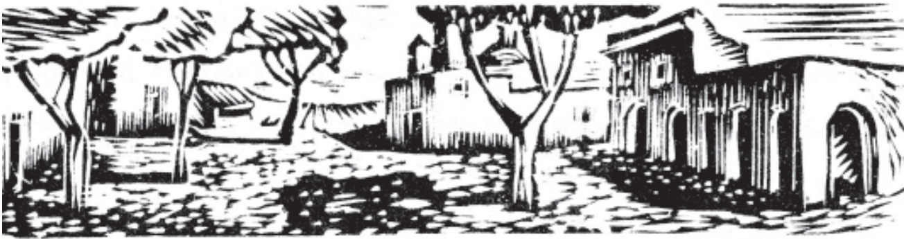
Grabados en madera de Julio Prieto.

los nombres de algunas personas e instituciones representativas del poder español, pero eso es todo: nombres, no personajes. Su presencia está subordinada a ese trazo a vista de pájaro que es Grandeza mexicana :