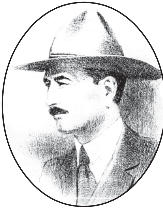
General Raúl Madero.